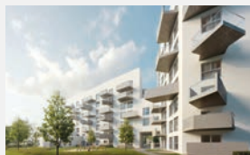
Gustav-Heinemann-Ring München 80 WE | EUR 38 Mio.