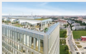
south one München-Obersendling 300 WE | -