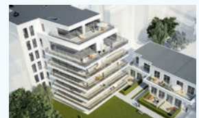
Friedensalle 29 Hamburg-Ottensen 20 WE