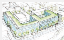
Rosensteinstraße Stuttgart 650 WE + Gewerbe | EUR 242 Mio.