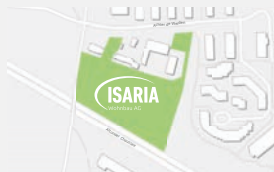
Achter de Weiden Hamburg-Schenefeld in Entwicklung