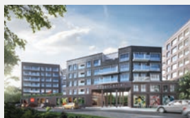
HegenCenter Hamburg-Rahlstedt 110 WE + Gewerbe | EUR 67 Mio.