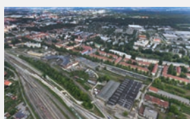
Firnhaber Straße Augsburg 500 WE | -