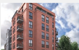
Graumannsweg Hamburg-Hohenfelde 27 WE + Gewerbe | EUR 9 Mio.