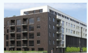
Drosselgärten Hamburg-Barmbek 48 WE