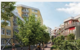
Hansastrasse München-Sendling 70 WE + Gewerbe | EUR 50 Mio.