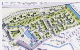
Papierfabrik Dachau 950 WE + Gewerbe | EUR 639 Mio.