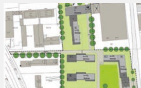
Preußenstraße München 250 WE + Gewerbe | -