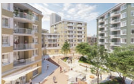
Tübinger Straße München-Sendling 192 WE + Gewerbe | EUR 136 Mio.

Anzahl geplanter Wohneinheiten (WE) zzgl. weiterer geplanter (gewerblicher) Flächen | Verkaufsvolumen**