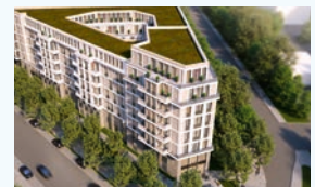
Elsenheimerstraße München-Westend 350 WE