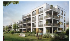
Nido München-Karlsfeld 566 WE